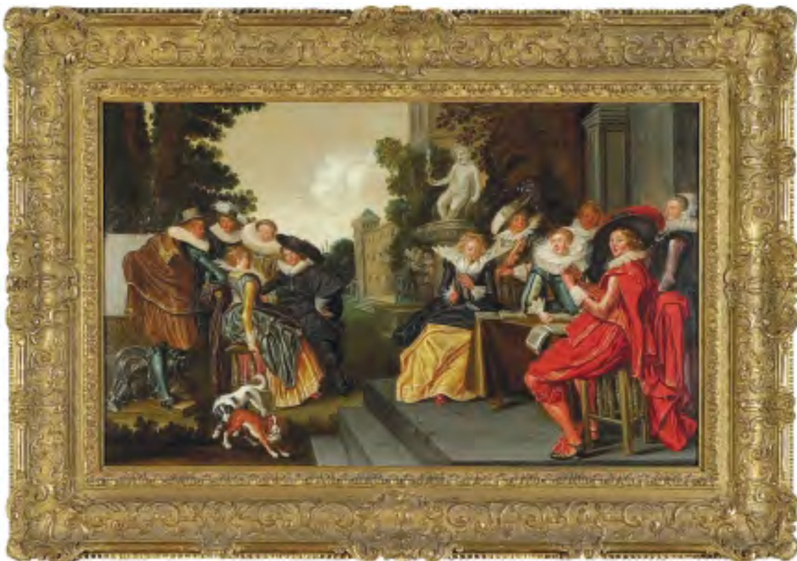
11. Musicerend gezelschap op een terras van Dirk Hals (NK 1456)

In haar beslissing van 23 januari 2004 volgde de staatssecretaris dit advies en honoreerde zij de claim van verzoeker tot teruggave van Musicerend gezelschap op een terras van Dirk Hals.