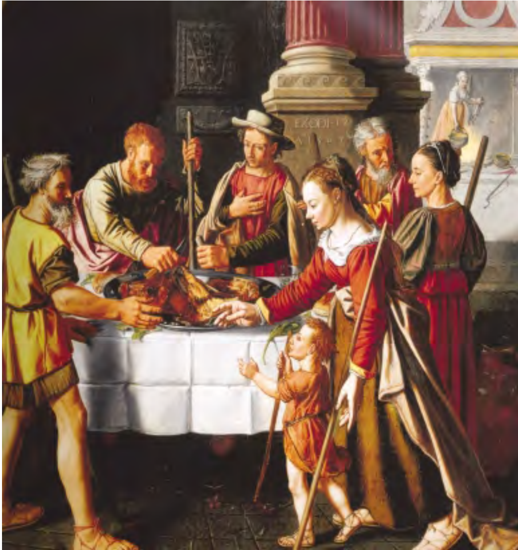
13. Paaslam toegeschreven aan Huybrecht Beuckeleer

Onlangs ontving de Restitutie Commissie het bericht dat het schilderij Paaslam , toegeschreven aan Huybrecht Beuckeleer, door de in de Verenigde Staten wonende erfgenaam van de oorspronkelijke eigenaren in bruikleen is gegeven aan het Ringling Museum in Sarasita in Florida. Dit schilderij behoorde tot de oorlog toe aan een Oostenrijks-joodse familie en is in 2002 op advies van de commissie door de Nederlandse overheid aan de erfgenamen teruggegeven. Daarvoor maakte het deel uit van de NK-collectie en was het te zien in het Bonnefantenmuseum in Maastricht.