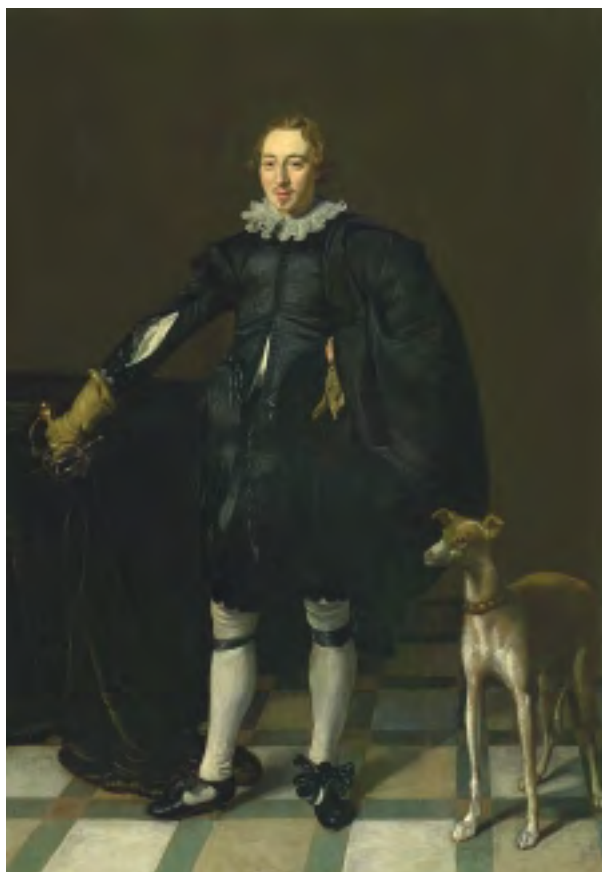
2. Portret van een man met een hazewindhond van Thomas de Keyser (NK 1407)

Op 7 april 2003 adviseerde de Restitutie Commissie de staatssecretaris over een verzoek tot teruggave van de schilderijen Portret van een man met een hazewindhond van Thomas de Keyser (NK 1407) en De slapende herbergierster , een kopie naar Nicolaas Maes (NK 1624). 4 Dit verzoek werd op 2 april 2002 door de staatssecretaris aan de commissie voorgelegd naar aanleiding van een claim op de beide werken, die namens de erven van de oorspronkelijke eigenaar op 22 april 2001 was ingediend. Het onderzoek naar de herkomst van de werken en naar de omstandigheden van het bezitsverlies tijdens de oorlog was in 2001 ingezet door de Inspectie Cultuurbezit. De Restitutie Commissie nam dit onderzoek bij de aanvang van haar werkzaamheden over.