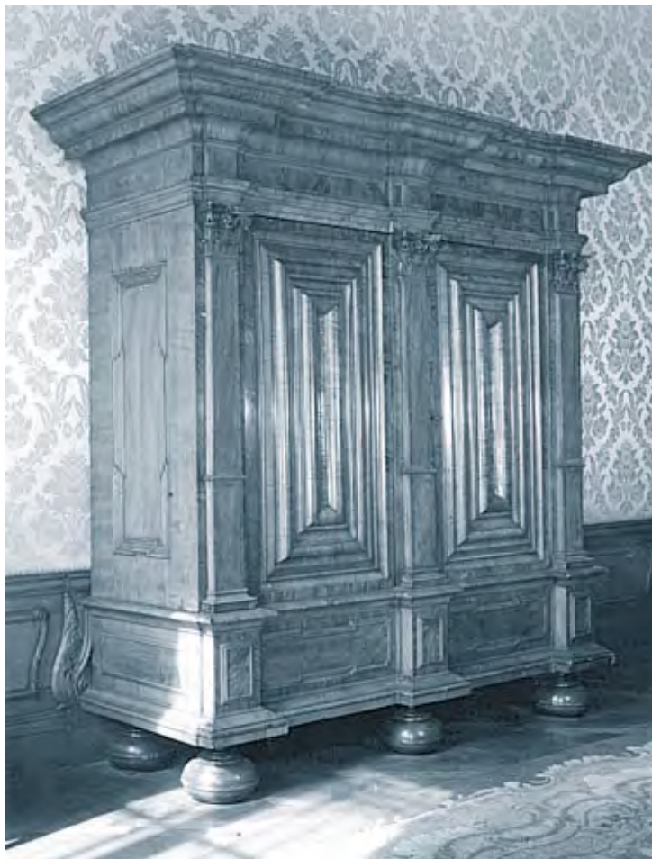
7. 18e eeuwse Frankfurtse kast (NK 986)

Van de gebeurtenissen rond het bezitsverlies van de kast door de familie is het volgende bekend. Bij het onderzoek werd een document uit 1957 gevonden, waarin de moeder van verzoekster vanuit de Verenigde Staten opgave doet van tijdens de oorlog uit haar huis gestolen goederen. Op deze lijst komt een 'Frankfurtse kast' voor. Hieruit maakte de commissie op dat de familie in ieder geval een Frankfurtse kast bezat. Om meer inzicht te krijgen in de mogelijkheden om de kast met registratienummer NK 986 te identificeren, wendde de commissie zich tot een meubelexpert. De heer dr. R. Baarsen, conservator bij het Rijksmuseum in Amsterdam, beschrijft de kast als "...een voorbeeld van een bergmeubel dat in de periode 1690-1760 in grote hoeveelheden is gemaakt", maar merkt daarbij op dat het onderhavige meubel een aantal ongewone karakteristieken heeft, die "... het vrij bijzonder en makkelijk herkenbaar maken..." Volgens hem kan aan de hand van een afbeelding, zelfs als daar slechts een klein deel van een kast op afgebeeld staat dat volledig overeenkomt met NK 986, de identiteit van de kast worden vastgesteld. Verzoekster noch haar familie beschikt echter over foto's. Wel herinnerde verzoekster zich enkele karakteristieken van de kast. Hoewel niet uniek, zijn deze niet herkenbaar op de foto die verzoekster onder ogen had gehad, en stemmen zij wel overeen met de als NK 986 geregistreerde kast.