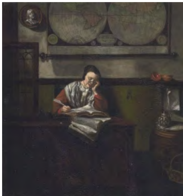
3. De slapende herbergierster naar Nicolaas Maes (NK 1624)