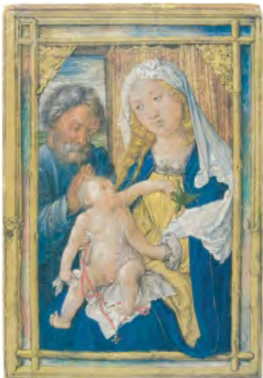
8. De heilige familie van A. Dürer (NK 3550, Koenigscollectie)

verzoekster ook de zoon van de heer F.W. Koenigs werd gehoord. 7 Het onderzoek resulteerde in een conceptonderzoeksrapport, dat voor commentaar werd voorgelegd aan verzoekster. Naar aanleiding van de reactie van de zijde van verzoekster werd dit rapport op punten aangepast. Op 3 november 2003 tenslotte stelde de commissie haar advies vast. Het onderzoeksrapport, opgesteld door haar secretaris/rapporteur, maakt integraal onderdeel uit van dit advies.