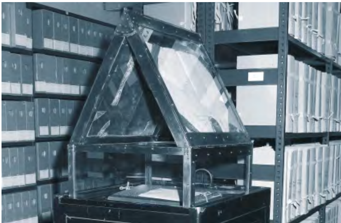
15. Interieur van een depot van het Nationaal Archief