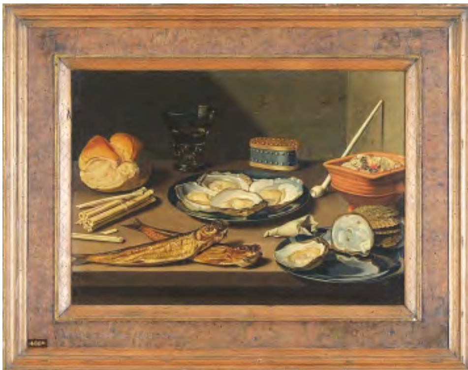
4. Stilleven met gerookte haring, oesters en rookgerei van Floris van Schooten (NK 1644)