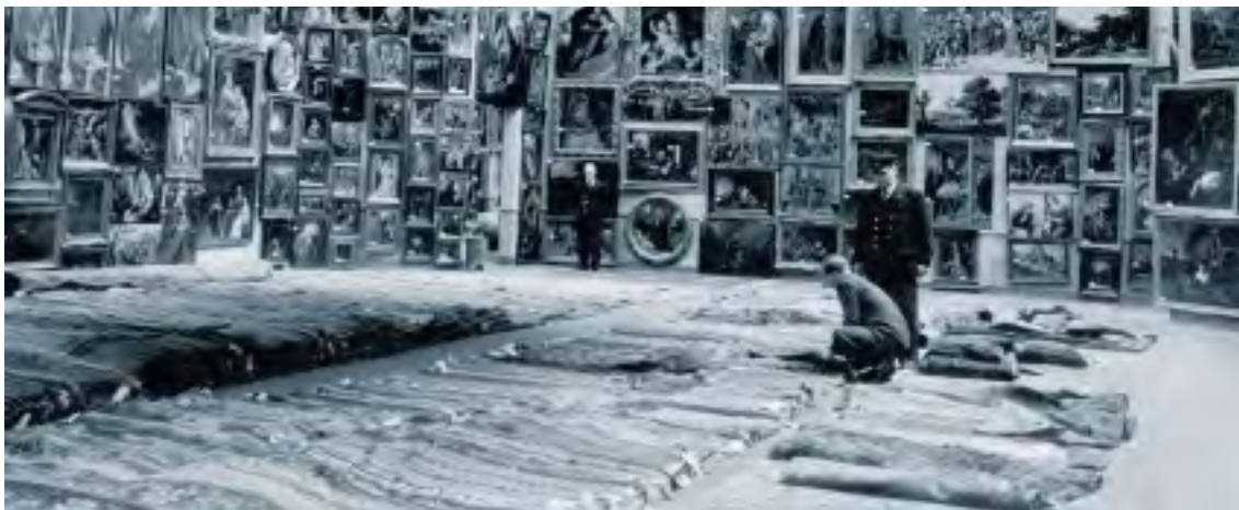
14. Claimtentoonstelling van schilderijen, tekeningen en tapijten in het Rijksmuseum, Amsterdam, 20 april-9 juni 1950

Gegeven het feit dat de commissie in 2003 nog niet te maken heeft gehad met zaken waarop het kunsthandelbeleid van toepassing is, zal dit beleid in dit Verslag 2003 niet nader worden besproken. De aanbevelingen van de Commissie Ekkart en de regeringsreactie zijn in hun geheel opgenomen als bijlagen bij dit Verslag. 17