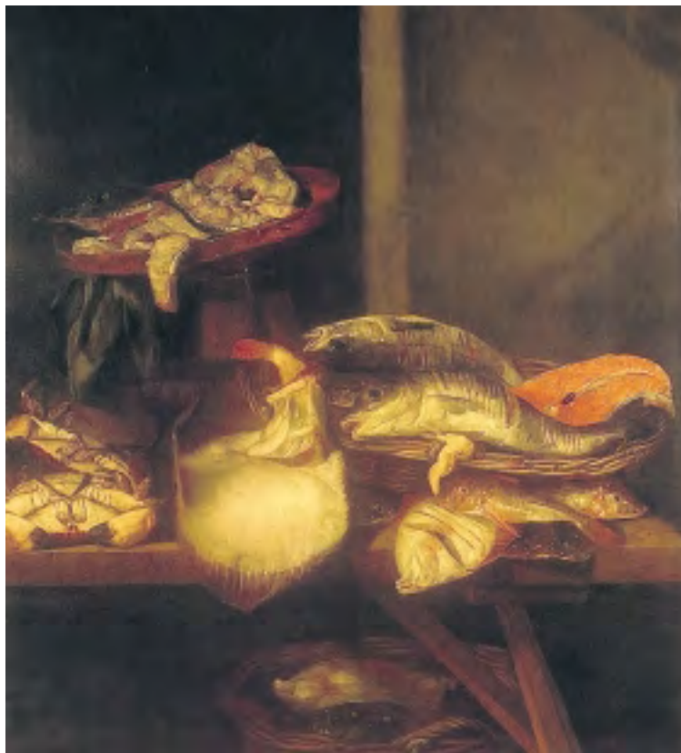
6. Stilleven met vis op schragentafel van A. van Beyeren (NK 2483)

Op 24 september 2002 verzocht de Staatssecretaris van Cultuur de Restitutie Commissie om advies over een verzoek om teruggave van het 17e eeuwse doek Stilleven met vis op schragentafel van A. van Beyeren (NK 2483). Verzoekster diende namens de erven van haar joodse grootvader op 9 september 2002 een restitutieverzoek in bij de staatssecretaris. Dit deed zij naar aanleiding van een publicatie over de herkomstgeschiedenis van het schilderij op de website van Bureau Herkomst Gezocht (BHG), waarin zij de naam van haar grootvader meende te herkennen in de vermelding 'M.v.d.Sluis te Rotterdam'.