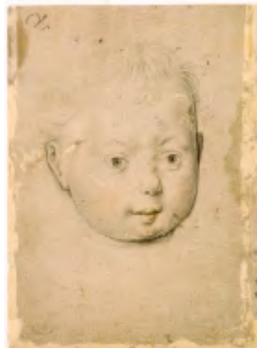
10. Portret van een kind van A. Holbein (NK 3575 - B, Koenigscollectie)