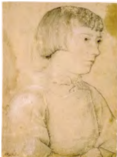
9. Portret van een jongen van A. Holbein (NK 3575 - A, Koenigscollectie)