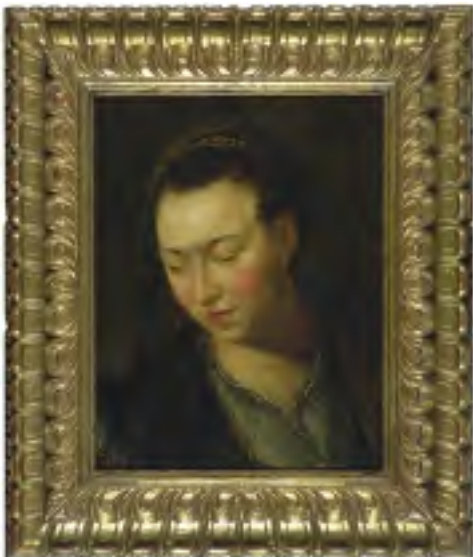
1. Hoofd van een jonge vrouw van een navolger van P.P. Rubens (NK 1546, Koenigscollectie)

De omvang van de gedurende 2003 afgehandelde zaken varieert. Het aantal kunstvoorwerpen waar het in deze zaken om gaat, loopt uiteen van een verzoek tot teruggave van een antieke kast tot een verzoek tot teruggave van een kunstcollectie van ruim zeventig schilderijen en tekeningen. Niet noodzakelijk evenredig met het aantal voorwerpen variëren ook de omvang van het onderzoek en de aard van de juridische, historische en ethische dilemma's waarvoor de commissie zich zag geplaatst. Bij de door de commissie in 2003 afgehandelde zaken ging het, evenals in 2002, telkens over kunstvoorwerpen die behoren tot de Rijkscollectie, dus in bezit c.q. beheer zijn van de rijksoverheid. Hieronder volgt een bespreking per zaak. De adviezen zijn in hun geheel als bijlage bij dit verslag opgenomen.